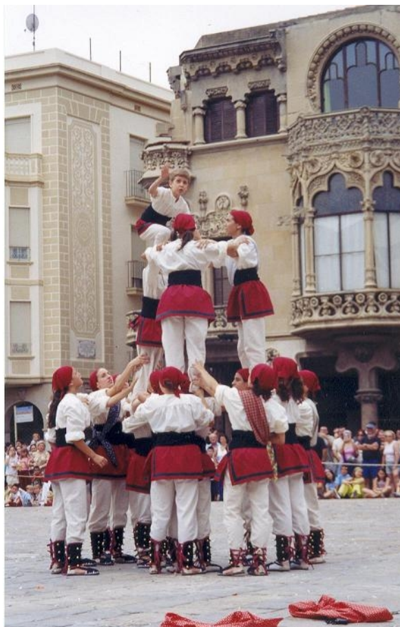
El castell del ball de valencians de Reus

“Hallandonos noticiosos; de qe. los bayles entran en esta Iglesia, y hacen dentro de ella Torres, ô, castillos, cometiéndose con este motivo grandes irreverencias en la Casa de Dios; Y debido por todos modos zelar el qe. se entre, y esté en el Templo con la Circunspección, Modestia, y respeto, qe. se debe â tan sagrado lugar: Por tanto prohibimos, qe. se hagan Torres, ô, castillos dentro la expresada Iglesia; para cuiio fin mandamos al Retor invigile en la Observancia de este Decreto. Y encargamos al Mageo. Bayle, y Ayuntamiento. Coho= pere por su parte p. al Cumplimto. de este nro. Mandato, no permitiendolo qe. entren otros Bayles dentro la Iglesia. =” 17